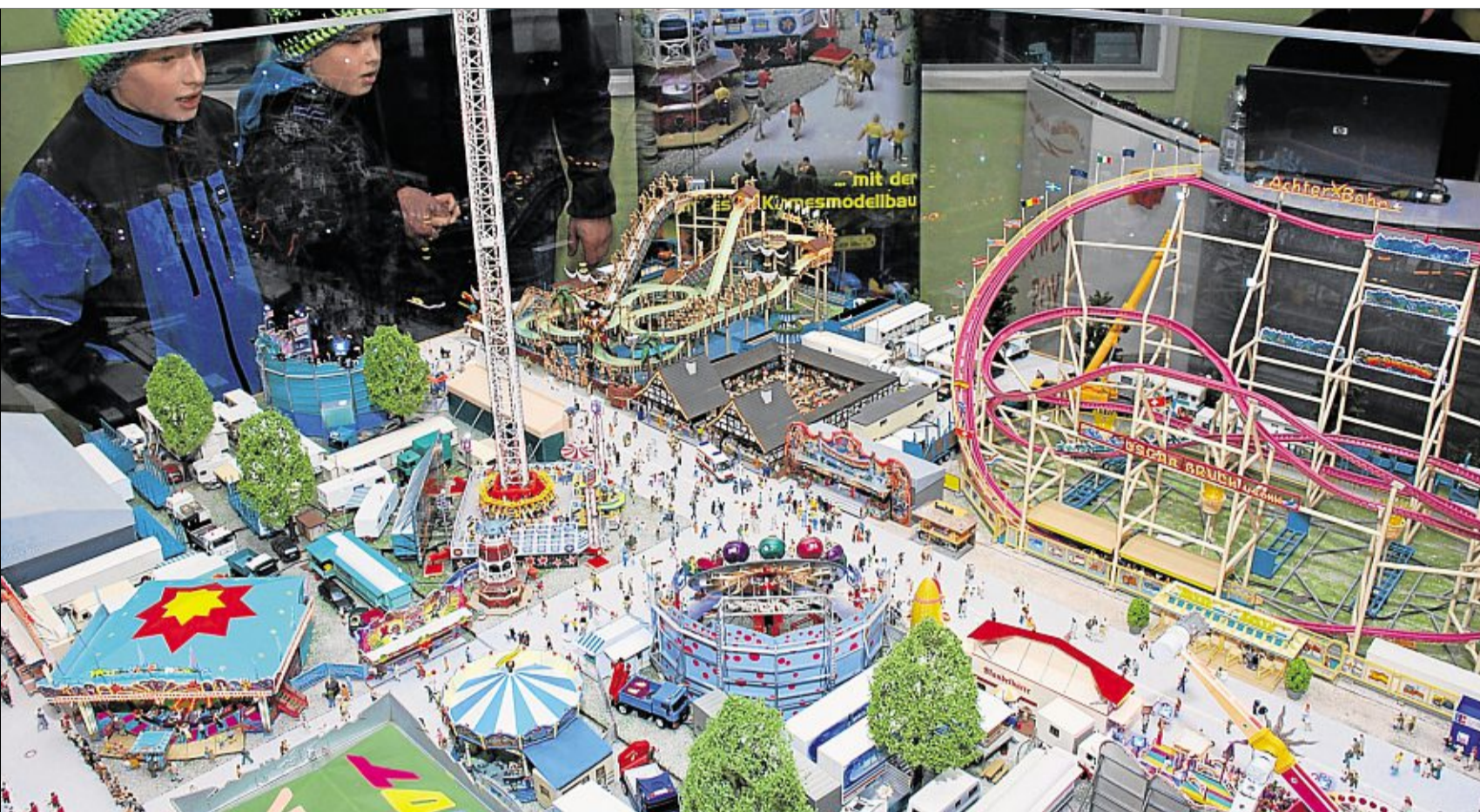
Kirmes-Modellbau – eine funktionsfähige Dult im Maßstab 1:87 – war eine der Hauptattraktionen bei der Ausstellung in der Krötenseeschule.